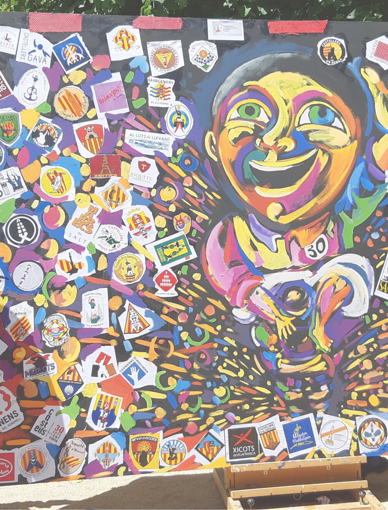
Imatge portada: imatge commemorativa del 30è aniversari de la CCC a càrrec de Jordi Llorens.