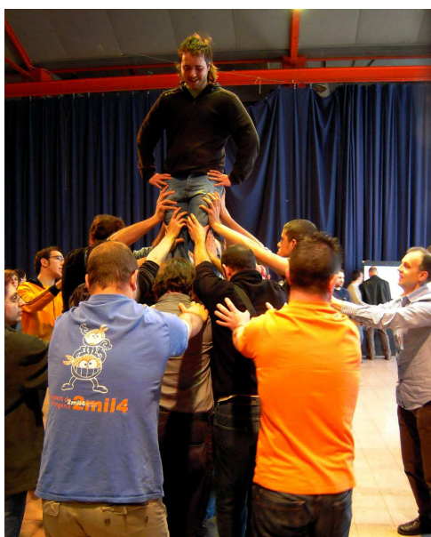
El cartell de la jornada i una imatge del taller de pilar caminant.