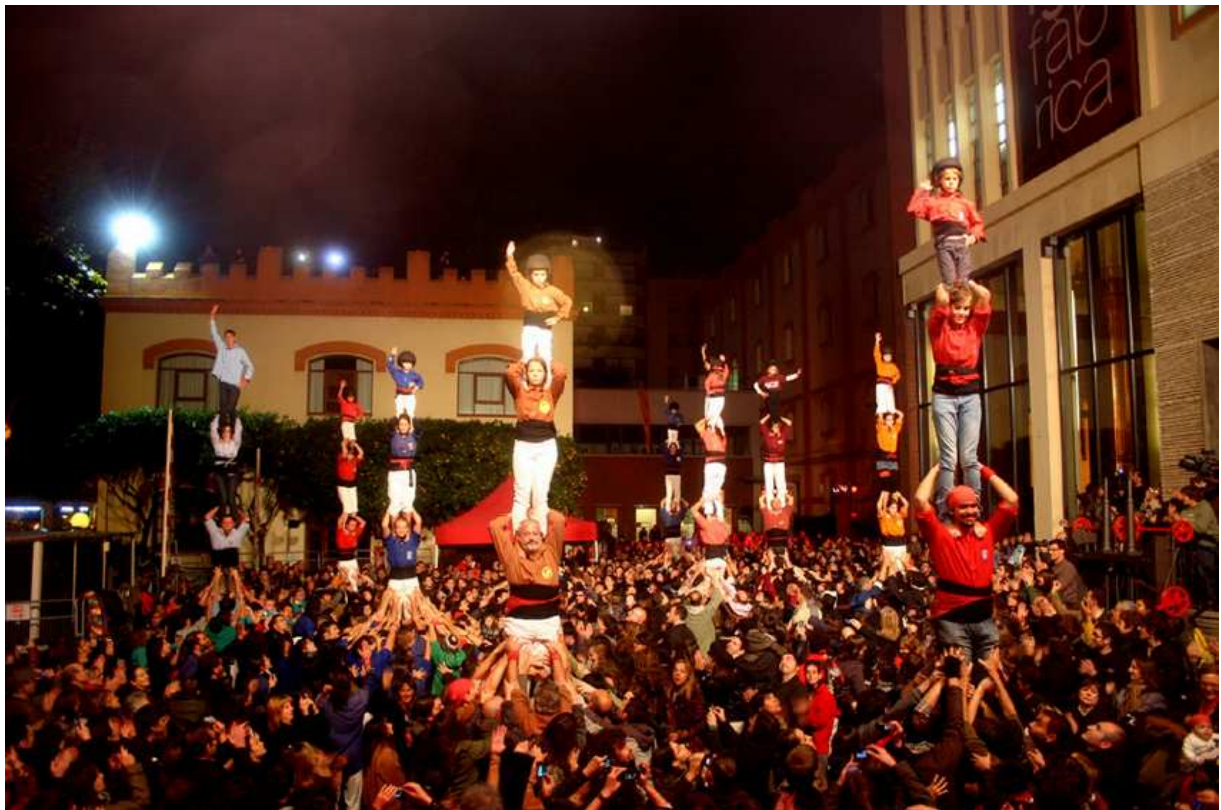
Pilars a la festa de celebració a la Damm.

Finalment, la Comissió Castells Patrimoni de la Humanitat i Damm van organitzar una festa de celebració, que es va fer a l'antiga fàbrica de la marca cervesera a Barcelona el 20 de novembre. Uns 2000 castellers i simpatitzants hi van assistir, i van poder gaudir de la música en directe de Lax'n Busto i Teràpia de Xoc.