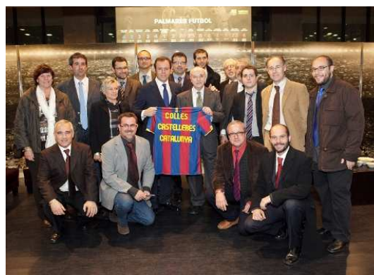
A l'esquerra, lliurament del Memorial Francesc Candel, i la dreta, l'acte amb el FC Barcelona.