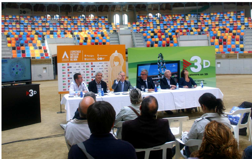
Roda de premsa de presentació de la cobertura de TVC del Concurs.