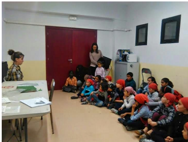
Explicació al nens com es gestionarà el grup aquesta temporada (cap de canalla)

1. Informació als infants: Es considera molt important que a la canalla els hi arribi la informació dels canvis produïts a través del propi equip tècnic de canalla, ja que això garanteix una informació clara de perquè s'han produït els canvis en la canalla. És la pròpia cap de canalla qui abans de l'inici de temporada, en època de tallers reuneix a tota la canalla i els hi explica el perquè i el funcionament dels nous grups tan a l'hora d'assaig com a les diades.