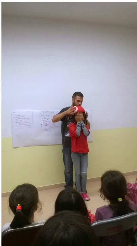
Xerrada sobre la col·locació dels cascos de la canalla

•Formació específica: Es realitzaran xerrades específiques als infants on es recorda la importància de portar el casc, així com se'ls explica la forma correcte de portar el casc i el perquè. També es recorda la importància de portar faixa, i sabatilles o xancles a tota la canalla (tan a la plaça com a l'assaig)