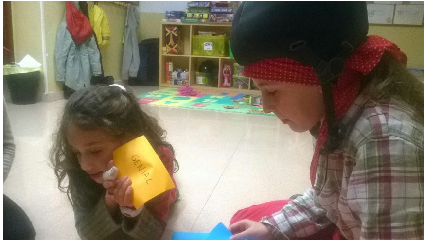
Ens etiquetem els uns als altres