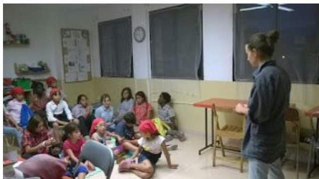
La "tècnica en trasllats" explica a la canalla com s'han de comportar a les Diades i a els trajectes.

·Xerrades específiques: Al llarg de tota la temporada es realitzaran xerrades informatives a la canalla de com s'han de comportar a l'autobús i a la plaça.