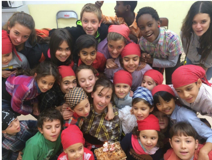
Aniversari de la cap de canalla

·Confiança: per tal de poder realitzar un castell amb la màxima seguretat tant per l'infant com per la resta de la colla creiem que és indispensable que els nens confiïn en les persones que els hi tenen cura, i de que les decisions que es prenen (qui realitza cada castell, quan un castell es tira avall, etc..) són realitzades sempre buscant la màxima seguretat de tots els components. Per això realitzem activitats i dinàmiques que fomentin la confiança entre ells, amb l'equip tècnic de canalla i amb d'altres membres de la Junta Directiva. Al mateix temps es realitza una escolta activa als infants en la que es dóna especial importància i es busquen solucions a aquelles inquietuds que presenten els nens.