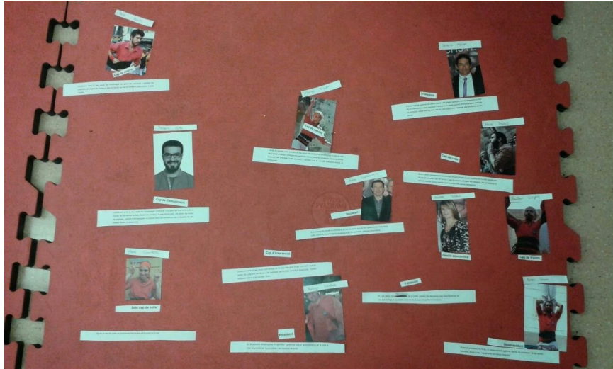
Organigrama de la colla