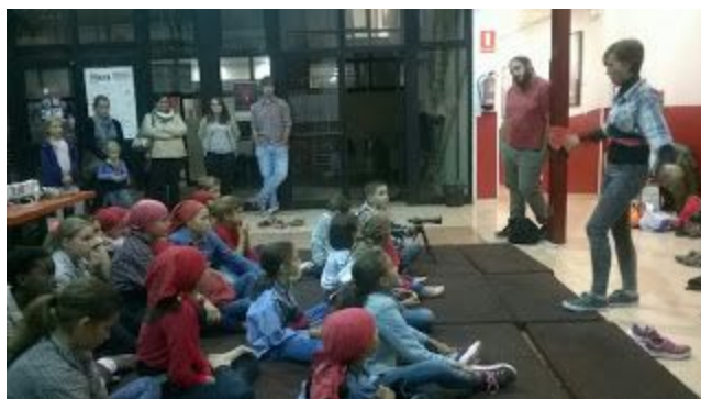
Explicació a la canalla de les decisions tècniques que es prenen en una diada (cap de canalla i cap de colla)

2. Informació a les famílies: Per tal d'evitar possibles conflictes i mals entesos amb les famílies el cap de canalla es posa en contacte amb tots els pares o tutors de legals dels nens, explicant un per un el nou funcionament i en quin grup està cada nen, juntament amb la demanda horària i de