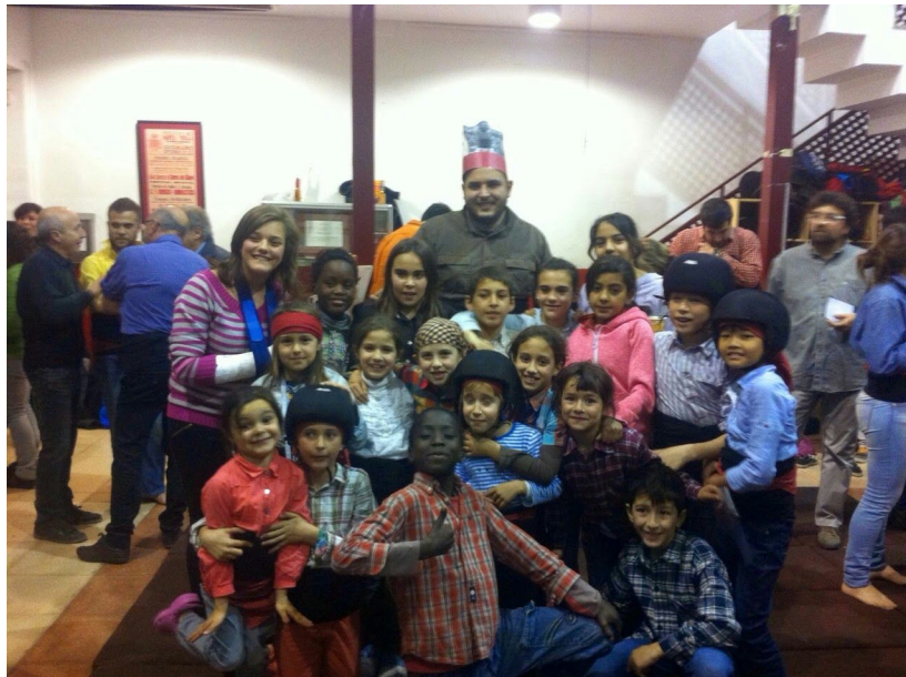
Aniversari del cap de colla

·Relaxació: Incorporarem activitats de relaxació i concentració al llarg de l'assaig d'adults per tal d'evitar possibles estats de nervis en els nens. També al llarg de les diades oferim activitats i jocs tranquils als nens, i així evitar les situacions d'estrès en ells.