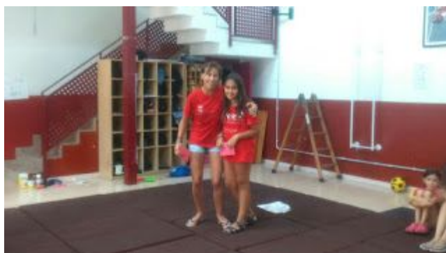
Premi a la canalla que presenta millor actitud a l'assaig.

A l'hora de portar un castell a plaça creiem que és imprescindible la bona relació entre la canalla, ja que és important poder treballar en equip i confiar l'un en el altre. Per això hem realitzat un Projecte específic de Resolució de Conflictes 2 entre la canalla, posant èmfasis especial a la relació entre canalla i canalleta. Hi ha una primera fase de prevenció on marquem les bases sobre les que volem que es construeixi la dinàmica grupal: el respecte als altres. Després hi ha una segona fase de detecció de conflictes, amb l'observació directa a l'infant i l'escolta activa de les famílies i els infants, per facilitar la comunicació de les famílies i infants amb l'equip de canalla es crea la figura del "síndic de les famílies" que és una persona no membre de l'equip de canalla que recull les preocupacions de les famílies i les transmet a l'equip de canalla i/o a la Junta Directiva. En la tercera fase es busquen solucions i es posen en pràctica per tal de solucionar els problemes. Per últim es fa una nova intervenció en la que s'avalua el grau d'impacte de les solucions proposades, tot buscant noves solucions a aquelles que no han funcionat bé.