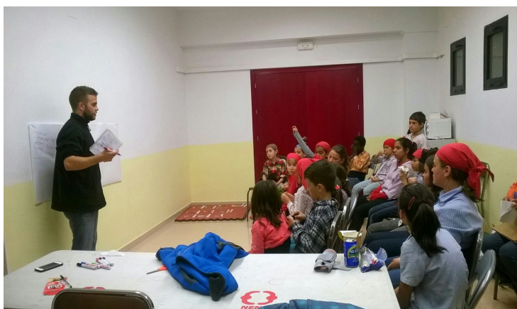
Xerrada sobre què hem de portar a les Diades

·L'alimentació a les diades: S'informa a les famílies de la importància de que els nens s'alimentin bé a les Diades, recomanant que portin dinar o sopar en una carmanyola o entrepà. Es realitzarà una xerrada informativa a la canalla recordant-los que han de portar menjar i aigua a totes les diades, inclús si després hi ha un dinar de la colla.