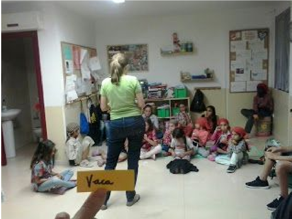
Dinàmica grupal on es fa reflexionar als nens sobre la seva actitud amb els altres.