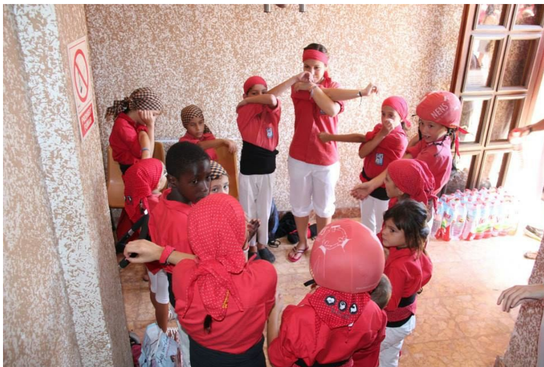
Escalfament previ a una Diada.

Escalfament previ a les diades: establím que abans de cada diada es realitzarà un escalfament amb la canalla.