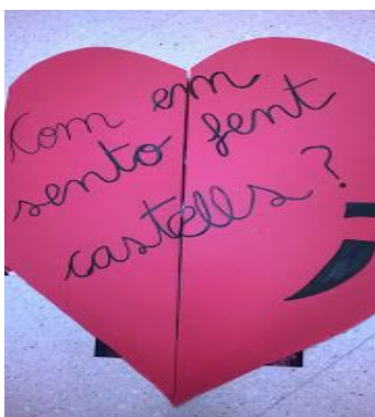
Lapbook de la canalla

·Reconeixement i identificació dels propis sentiments. Proponem la realització de dinàmiques grupals que facilitin el reconeixement dels propis sentiments al nen, per tal de poder facilitar aquesta informació als adults que l'envolten. Al mateix temps, s'acorden unes pautes perquè tots els tècnics recullin dades que podrien ser "emotivament significatives" en graelles al llarg de tots l'assaig de canalla (mostra por, demana pujar, es queixa alguna vegada quan ha de pujar, ha expressat algun sentiment o ha fet algun comentari durant l'assaig?) 3