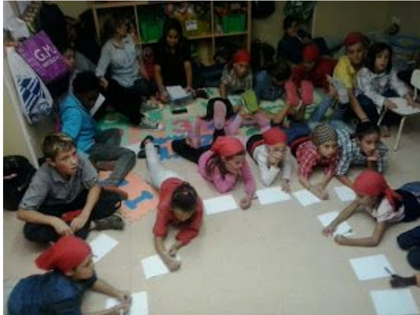
Els nens escriuen les seves preocupacions i problemes a la colla.

3. Escolta activa a les famílies: L'augment de la comunicació família/tècnics amb la creació de la figura del "síndic de famílies" facilita que les famílies puguin fer arribar a l'equip tècnic de canalla aquelles situacions que creguin que poden causar malestar als nens. Al mateix temps es busca un tècnic referent per a cada nen de manera que puguin fer arribar a l'equip tècnic de canalla qualsevol opinió que el nen expressi a casa seva.