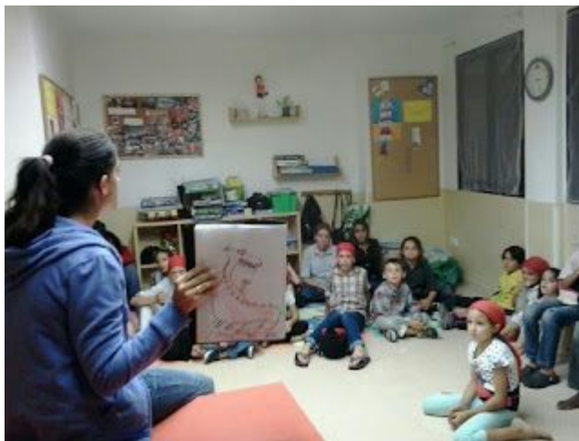
Explicació de l'adaptació del conte "Jo sóc un drac"

Abans d'acabar la temporada recollim novament les dades de conflictes entre canalla i canalleta, i novament només aquest nen té conflictes. És llavors quan es decideix intervenir per a protegir la resta canalla d'aquesta actitud. S'adapta un conte de l'editorial Baula (“Sóc un drac”) en el que es presenta la reacció negativa d'alguns infants a les preses de decisions dels adults i les conseqüències d'aquestes actituds i el fet de recolzar-les. Després es fa una nova dinàmica de grup en la que es pregunta als nens com es poden millorar aquestes reaccions de rebuig.