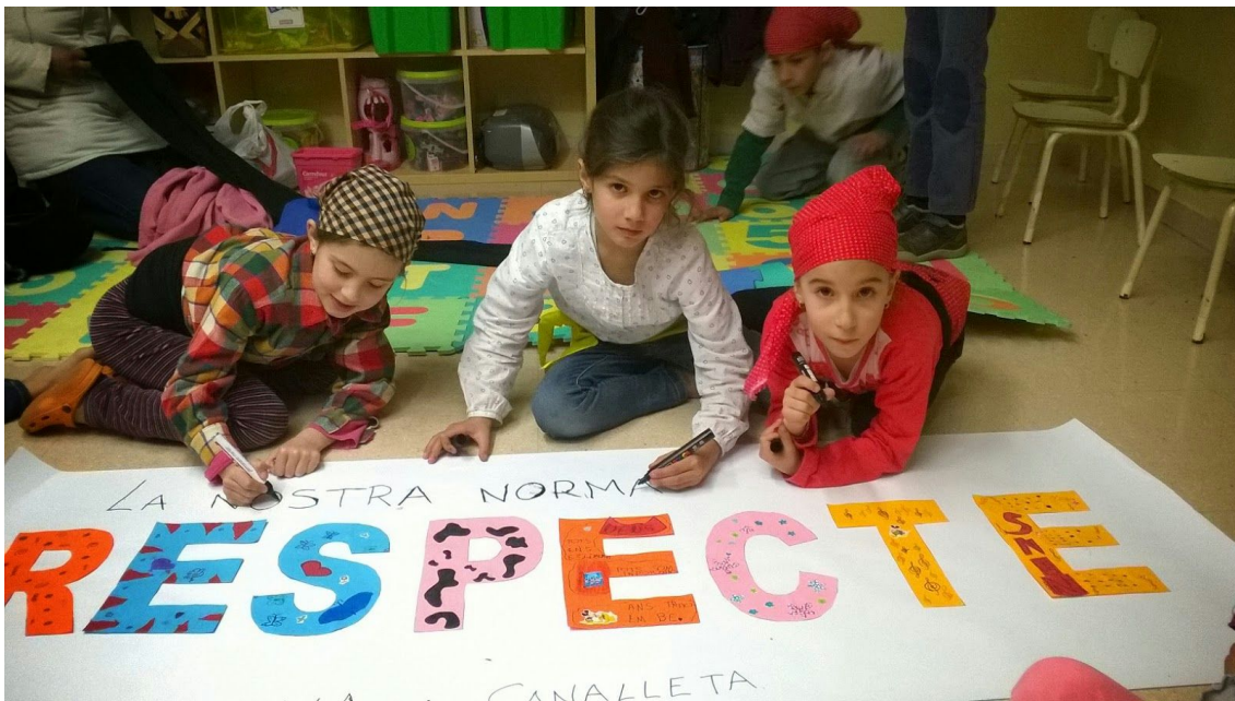
Elaboració d'un mural amb la nostra norma de conducta

Es dóna a conèixer als nens què implica el compliment d'aquestes normes i com han d'actuar. I que en cas d'incompliment hi haurà unes mesures de càstig consensuades entre tot l'equip tècnic de canalla.