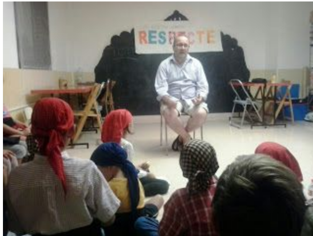
Explicació del projecte “Fem pinya” a la canalla

·La importància de la correcte alimentació de tots: Degut a que els Nens del Vendrell són la imatge del projecte “Fem Pinya” que és un projecte creat per a recollir fons per les beques de menjador escolar al Vendrell, creiem convenient involucrar i fer participants a la canalla i canalleta d'aquest projecte. Per això realitzem una activitat amb afany recaptatori tot posant en coneixement de tots els infants què és el projecte “Fem pinya” i la importància que té.