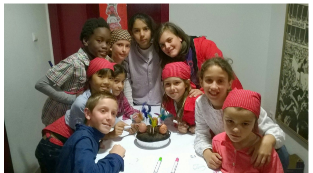
La mona de la canalla