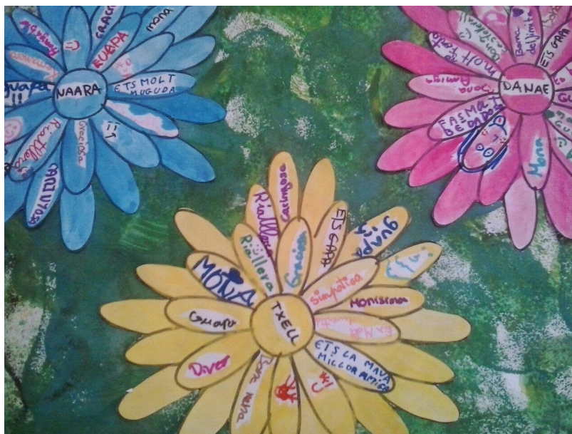
Ens busquem qualitats