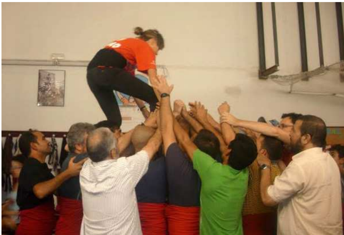
Diversos moments dels tallers organitzats al Vendrell.