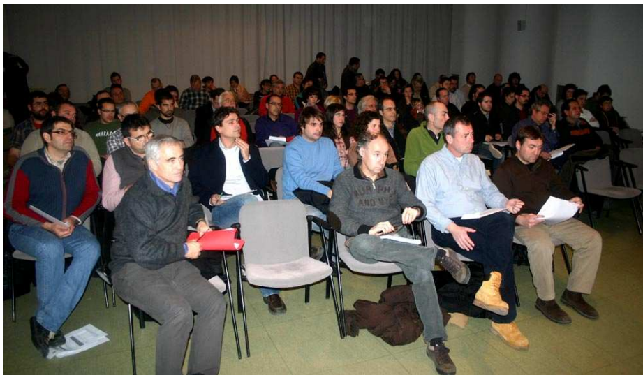
Un moment de l'assemblea d'aprovació dels estatuts.

Finalment, els nous estatuts van ser aprovats en assemblea extraordinària, celebrada a la Casa de Cultura de Valls, el 30 de gener de 2010 amb 435 vots a favor, 15 en contra i 25 en blanc. Entre les novetats del text, cal destacar un preàmbul titulat "Del fet casteller" que destaca que aquest "és una expressió de referència dins la cultura tradicional i popular del nostre país". D'altres articles busquen una major continuïtat i estabilitat de la tasca de la junta, permetent al mateix temps una renovació periòdica dels seus membres, alhora que es configura amb més precisió l'assemblea de colles com a màxim òrgan de la presa de decisions.