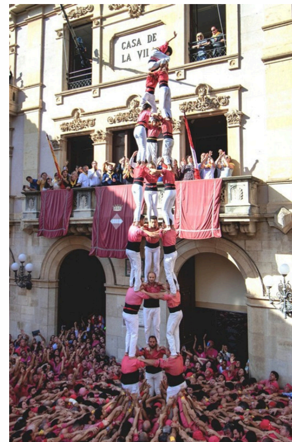
12 -2019 B

És important assegurar que les 2 imatges de 2019 queden de costat, la A a l'esquerra i la B a la dreta, amb la cartela entremig de les dues.