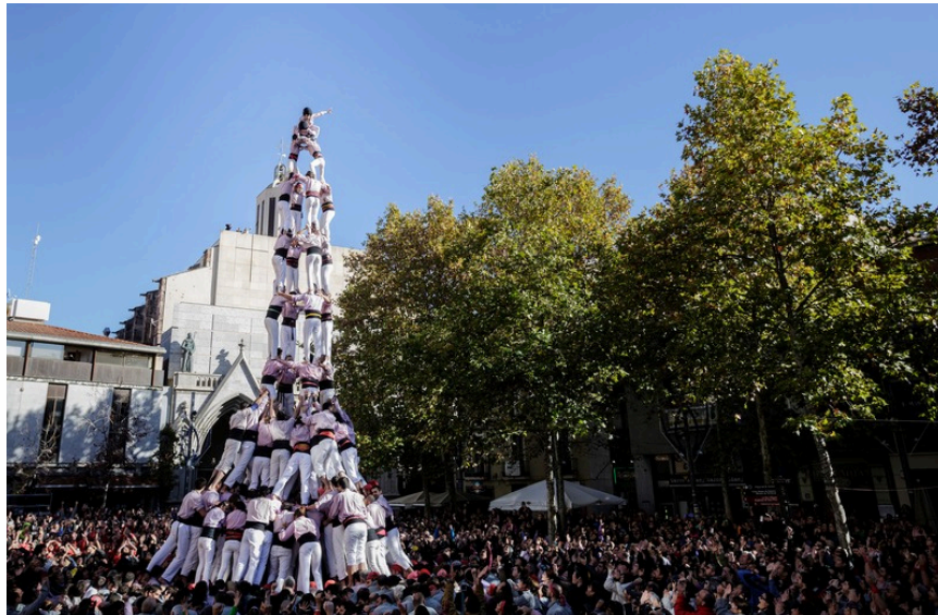
7 - 2015