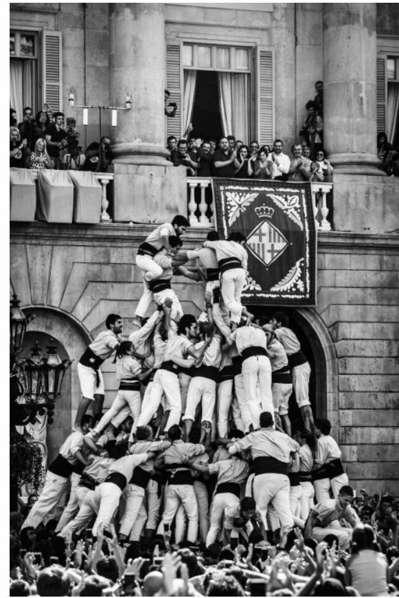
8 - 2016